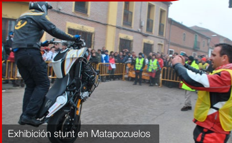
Exhibición stunt en Matapozuelos