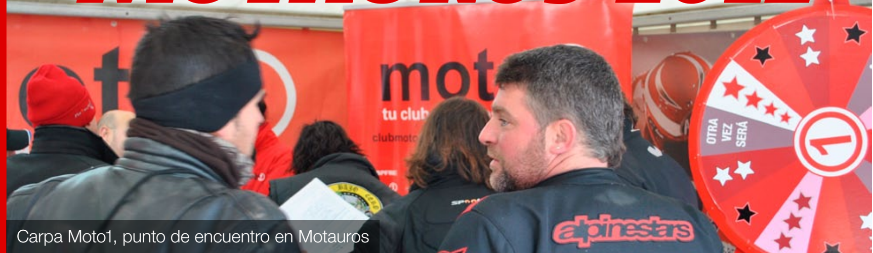
Carpa Moto1, punto de encuentro en Motauros