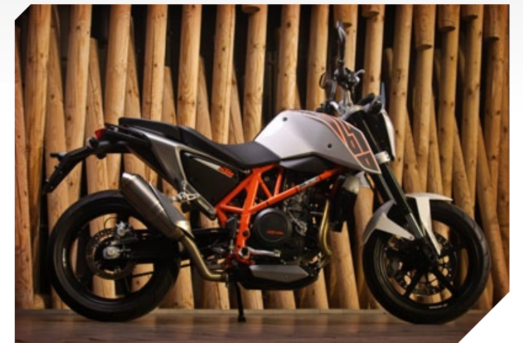
Duke 690 (2012)