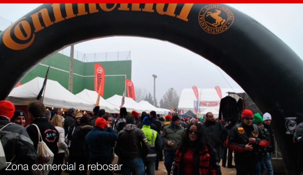
Zona comercial a rebosar