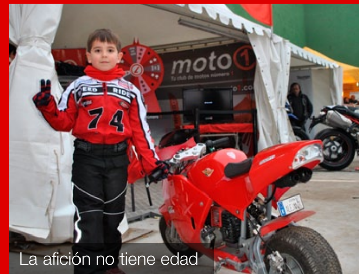
La afición no tiene edad