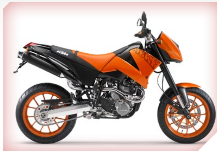
Duke 640 (1998)