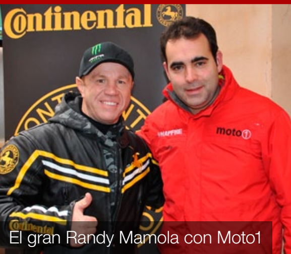
El gran Randy Mamola con Moto1