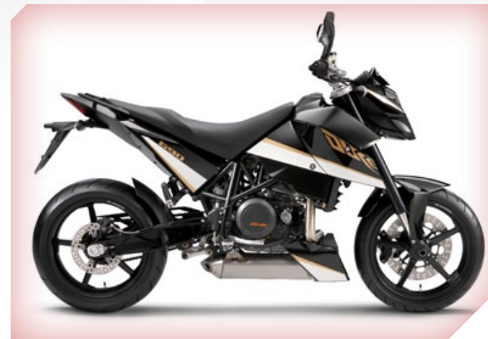
Duke 690 (2008)