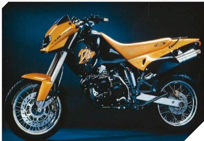
Duke 620 (1994)