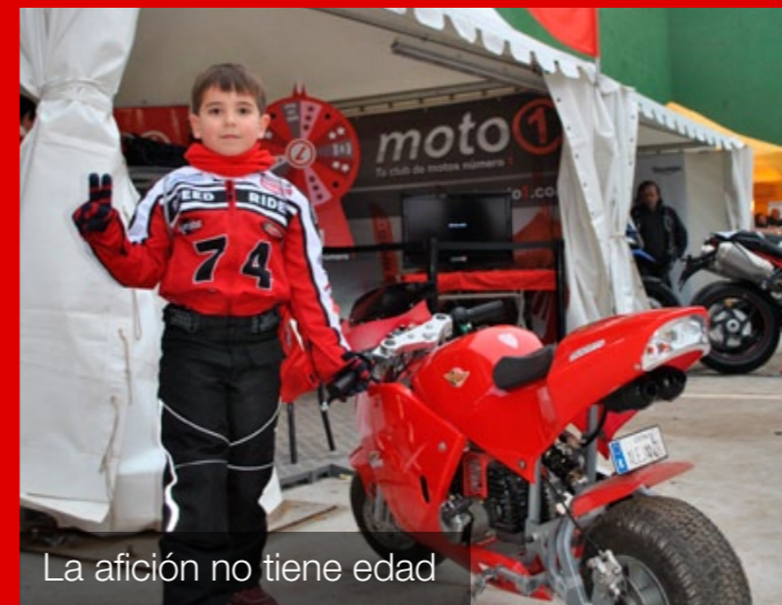
La afición no tiene edad