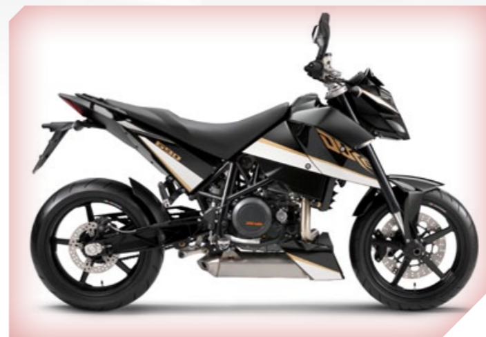
Duke 690 (2008)