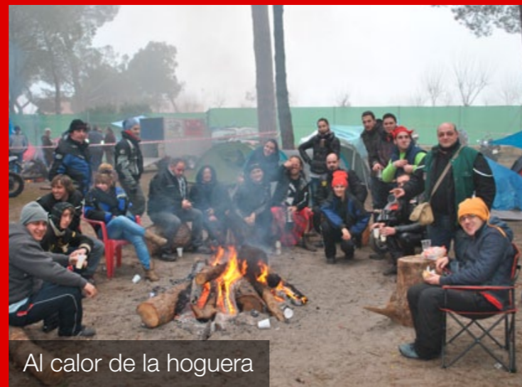
Al calor de la hoguera