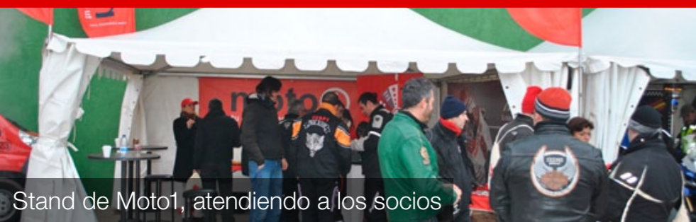
Stand de Moto1, atendiendo a los socios