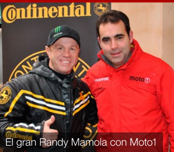
El gran Randy Mamola con Moto1