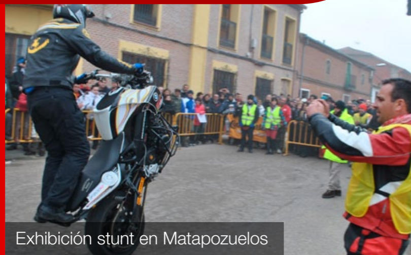
Exhibición stunt en Matapozuelos