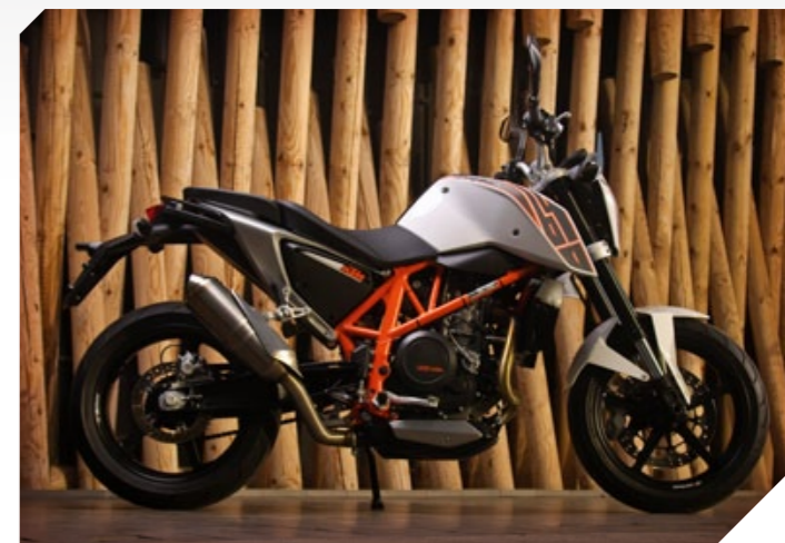
Duke 690 (2012)