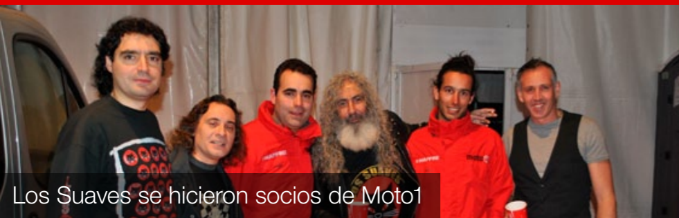
Los Suaves se hicieron socios de Moto1