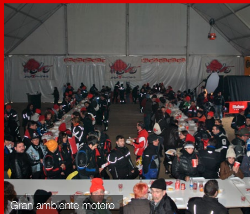
Gran ambiente motero