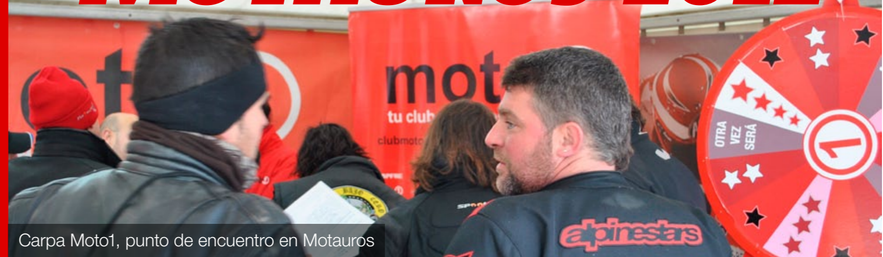
Carpa Moto1, punto de encuentro en Motauros