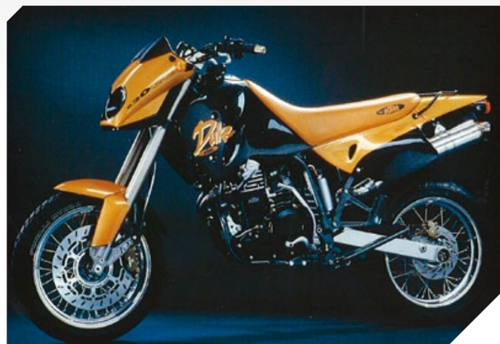
Duke 620 (1994)