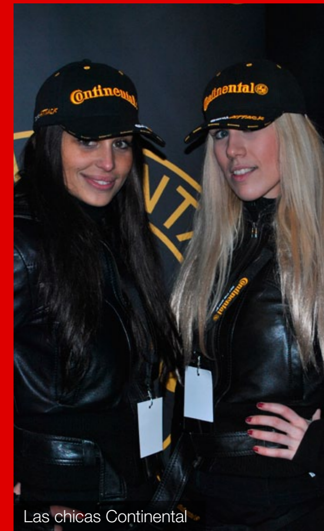
Las chicas Continental