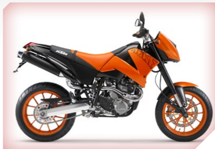
Duke 640 (1998)