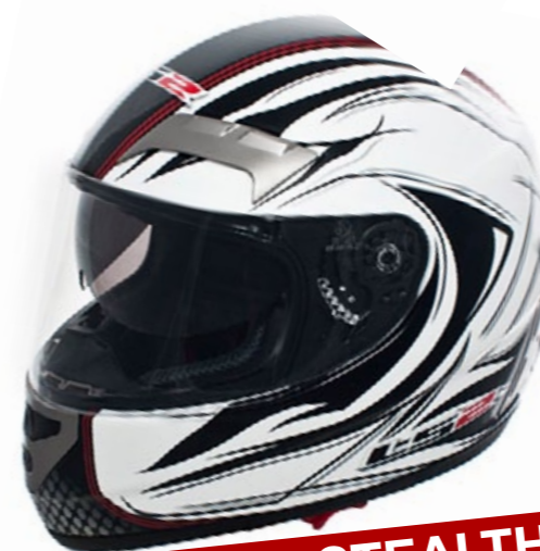
Casco LS2 STEALTH