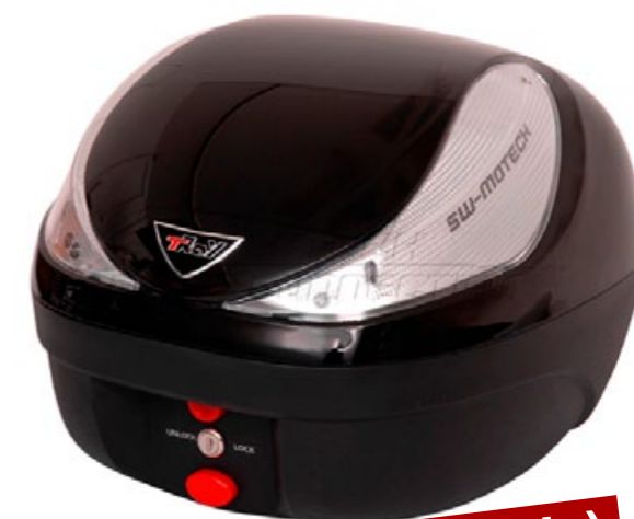
Topcase T-RAY (36L.)