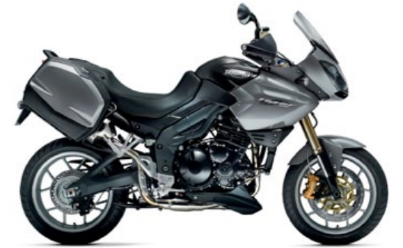
Triumph Tiger 1050