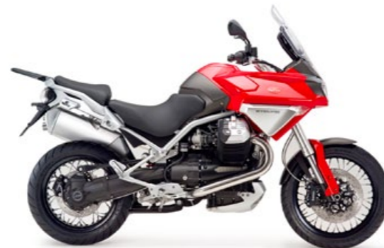
Moto Guzzi Stelvio 1200