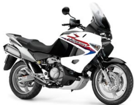
Honda XL 1000 Varadero