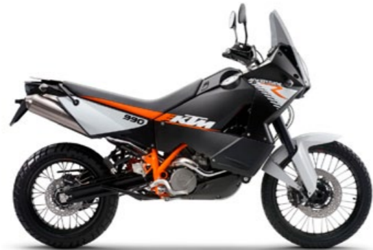
KTM Adventure 990