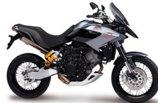
Morini 1200 Granpasso