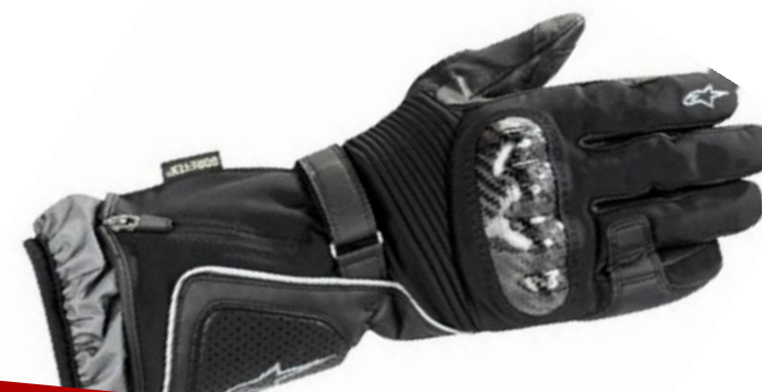
Alpinestars Jet Road Gore Tex

Estos son algunos de los productos que iremos sorteando a lo largo de este mes. Semana a semana en www.clubmoto1.com encontrarás las instrucciones de cómo participar en ellos. Ganar es sencillo. Muchos de los miembros del club ya se han beneficiado de las ventajas, ¡no lo dudes e insíbete!