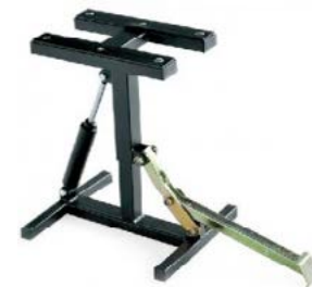
caballete con amortiguador