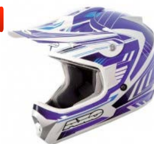
casco AXO SQUAD