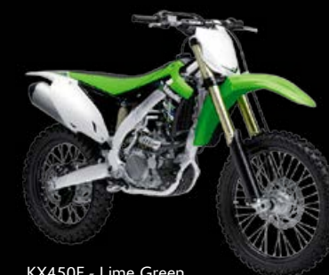
KX450F - Lime Green

Para más información visita www.kawasaki.es/KX250F o www.kawasaki.es/KX450F