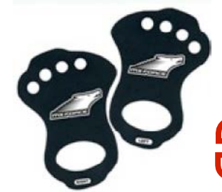
palm saver MX FORCE