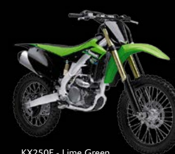
KX250F - Lime Green

Conduce siempre con responsabilidad, dentro del límite de tus habilidades, tu experiencia y tu moto. Usa un casco homologado y ropa protectora. Las acciones representadas aquí fueron llevadas a cabo por pilotos profesionales y en circuito cerrado.