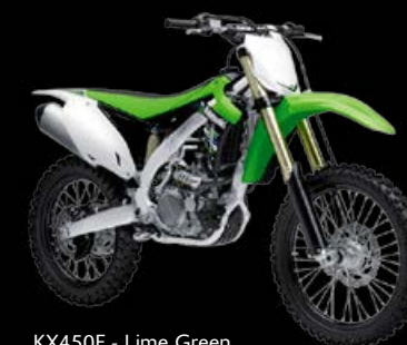
KX450F - Lime Green

Para más información visita www.kawasaki.es/KX250F o www.kawasaki.es/KX450F