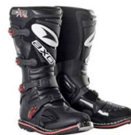
BOTAS AXO BOXER