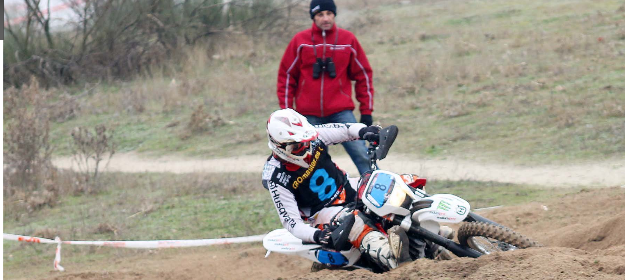
El equipo de pruebas de EnduroPro compitió con las Husqvarna 2013 TE 250R y TE 310R.