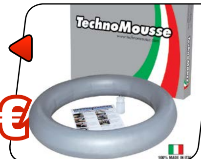
MOUSSE 18" o 21"