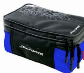
BOLSA GUARDABARROS TRASERO